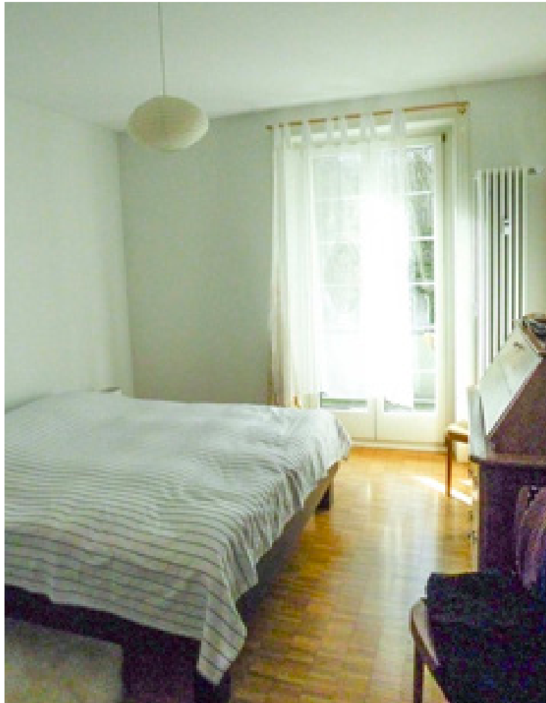
Schlafzimmer, mit Zugang Balkon