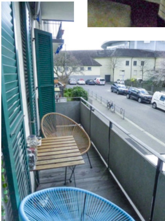
Balkon, auf Seite Optingenstrasse